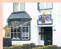
Mail een foto vaen versierde prinsenhuis