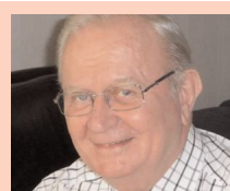
'We halen de mensen uit hun huis'