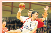
Glanerbrook kleur rood en wit